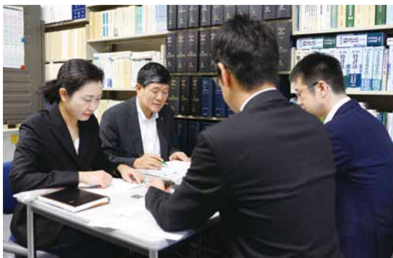
Technical Briefing by Judicial Research Official (裁判所調査官による技術説明)

裁判所調査官は，裁判所の命を受け，原則として，特許，実用新案等の技術型の知的財産権関係訴訟の全件に関与し，当該事件の審理，裁判に関して必要な技術的事項を調査します。また，裁判長の命を受けて，口頭弁論期日等において，訴訟関係を明瞭にするため，当事者に対して問いを発することなどができます（民事訴訟法92条の8）。