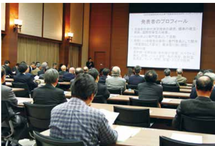
Annual Conference of Technical Advisors (専門委員実務研究会)

Technical advisors are part-time national public officers appointed by the Supreme Court, consisting of leading experts such as university professors and researchers of public institutions, who are engaged in research on cutting-edge technology in a wide range of specialized fields including electrical equipment, machinery, chemistry, information communications, and biotechnology. About 200 technical advisors are appointed nationwide. When a court makes a decision to designate a technical advisor for a certain case in order to clarify the matters related to the suit or ensure the smooth progress of court proceedings, the technical advisor would provide explanation. On the highly specialized, technical matters in dispute based on his/her expertise from a fair, neutral standpoint (Article 92-2 of the Code of Civil Procedure).