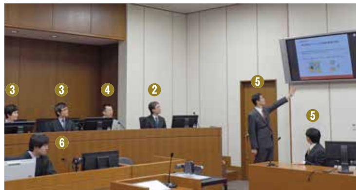
Explanatory Session (技術説明会)