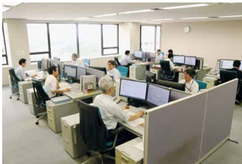
Office of Judicial Research Officials (裁判所調査官室)

In principle, upon receipt of a court order, judicial research officials are engaged in all technology-based IP-related litigations, such as those related to a patent or utility model, and conduct research on technical matters necessary for the court proceedings and judicial decisions for those cases. Upon an order by the presiding judge, judicial research officials can ask questions to the parties concerned on the date of oral argument or on other such occasions in order to clarify the matters related to the suit (Article 92-8 of the Code of Civil Procedure).