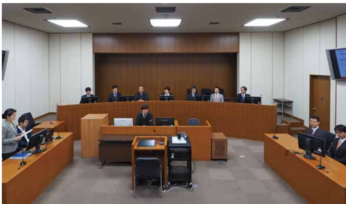
Explanatory Session (技術説明会)

After the presentation, the participants engage in a free, frank discussion allowing both parties, the technical advisors, the judges and the judicial research official to ask questions about the content of the presentation or unclear points in the arguments and evidence submitted beforehand, and technical advisors to present explanations about technical matters. The participants are expected to identify issues and deepen their understanding about the technical matters through these questions and the answers from the parties, and the explanations from technical advisors.