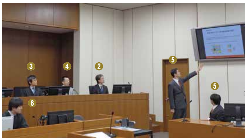
Explanatory Session (技術説明会)

プレゼンテーションの後、当事者相互間や、専門委員・裁判官・裁判所調査官から当事者に対し、当該プレゼンテーションの内容や従前の主張・立証で不明確な点等について、質問がされたり、専門委員から技術的事項についての説明がされたりして、自由な雰囲気での議論が行われます。これらの質問と当事者からの回答、専門委員からの説明等を通じて、争点が整理されるとともに、技術的事項に対するより深い理解が達成されることが期待されています。また、技術説明会は、弁論準備手続期日において、一方の当事者又は専門委員がウェブ会議で出頭して開催する方式で行われることがあります。