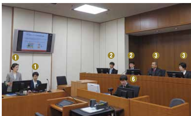
Explanatory Session (技術説明会)

After the presentation, the participants engage in a free, frank discussion allowing both parties, the technical advisors, the judges and the judicial research official to ask questions about the content of the presentation or unclear points in the arguments and evidence submitted beforehand, and the technical advisors to present explanations about technical matters. The participants are expected to arrange issues and deepen their understanding about the technical matters through these questions and the answers from the parties, and the explanations from the technical advisors. In some cases, an explanatory session is held using a web conferencing system on the date for preparatory proceedings in which one of the parties or some technical advisors participate via the web conferencing system.