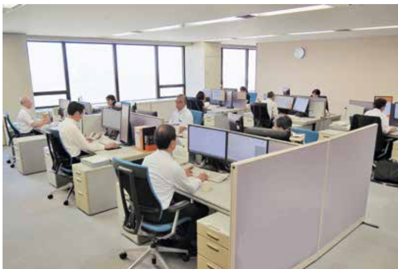
Office of Judicial Research Officials (裁判所調査官室)

In principle, as ordered by the court, judicial research officials are engaged in all technology-based IP-related litigations, such as those related to a patent or utility model, and conduct research on technical matters necessary for the court proceedings and judicial decisions for those cases. As ordered by the presiding judge, judicial research officials can ask questions to the parties concerned on the date of oral argument or on other such occasions in order to clarify the matters related to the suit (Article 92-8 of the Code of Civil Procedure).