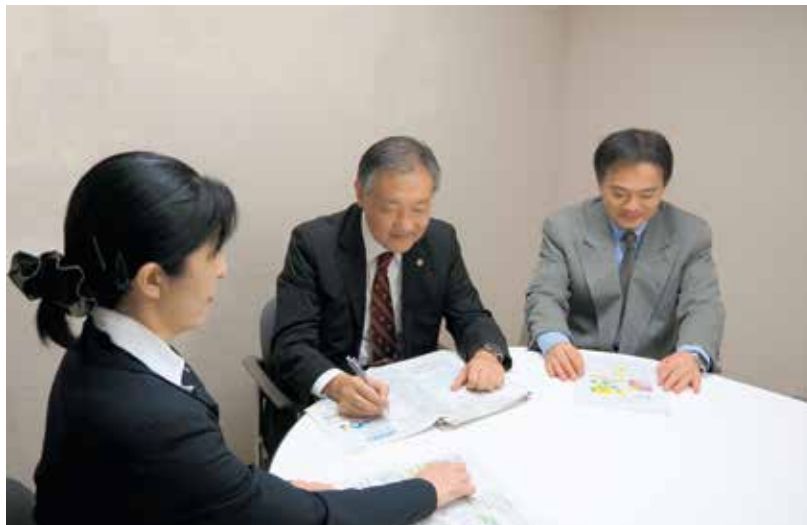
Technical Briefing by Judicial Research Official (裁判所調査官による技術説明)

裁判所調査官は，裁判所の命を受け，原則として，特許，実用新案等の技術型の知的財産権関係訴訟の全件に関与し，当該事件の審理，裁判に関して必要な技術的事項を調査します。また，裁判長の命を受けて，口頭弁論期日等において，訴訟関係を明瞭にするため，当事者に対して問いを発することなどができます（民事訴訟法92条の8）。