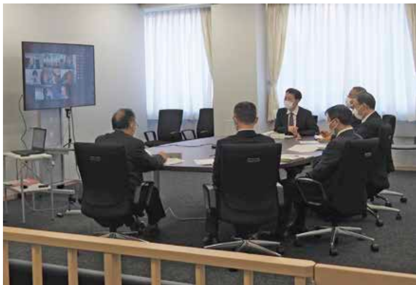
Annual Conference of Technical Advisors (専門委員実務研究会)

Technical advisors are part-time national public officers appointed by the Supreme Court, consisting of leading experts such as university professors and researchers of public institutions, who are engaged in research on cutting-edge technologies in a wide range of specialized fields including electrical equipment, machinery, chemistry, information communications, and biotechnology. About 200 technical advisors are appointed nationwide. When a court makes a decision to designate a technical advisor for a certain case in order to clarify the matters related to the suit or ensure the smooth progress of court proceedings, the technical advisor would provide explanation on the highly specialized, technical matters in dispute based on his/her expertise from a fair, neutral standpoint to the court (Article 92-2 of the Code of Civil Procedure).