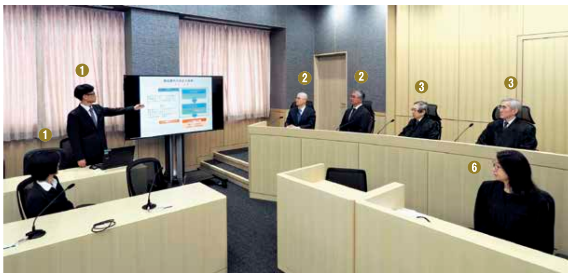
Explanatory Session (技術説明会)

After the presentation, the participants engage in a free, frank discussion allowing both parties, the technical advisors, the judges and the judicial research official to ask questions about the content of the presentation or unclear points in the arguments and evidence submitted beforehand, and the technical advisors to present explanations about technical matters. The participants are expected to arrange issues and deepen their understanding about the technical matters through these questions and the answers from the parties, and the explanations from the technical advisors. In some cases, an explanatory session is held using a web conferencing system on the date for preparatory proceedings in which the parties or some technical advisors participate online.