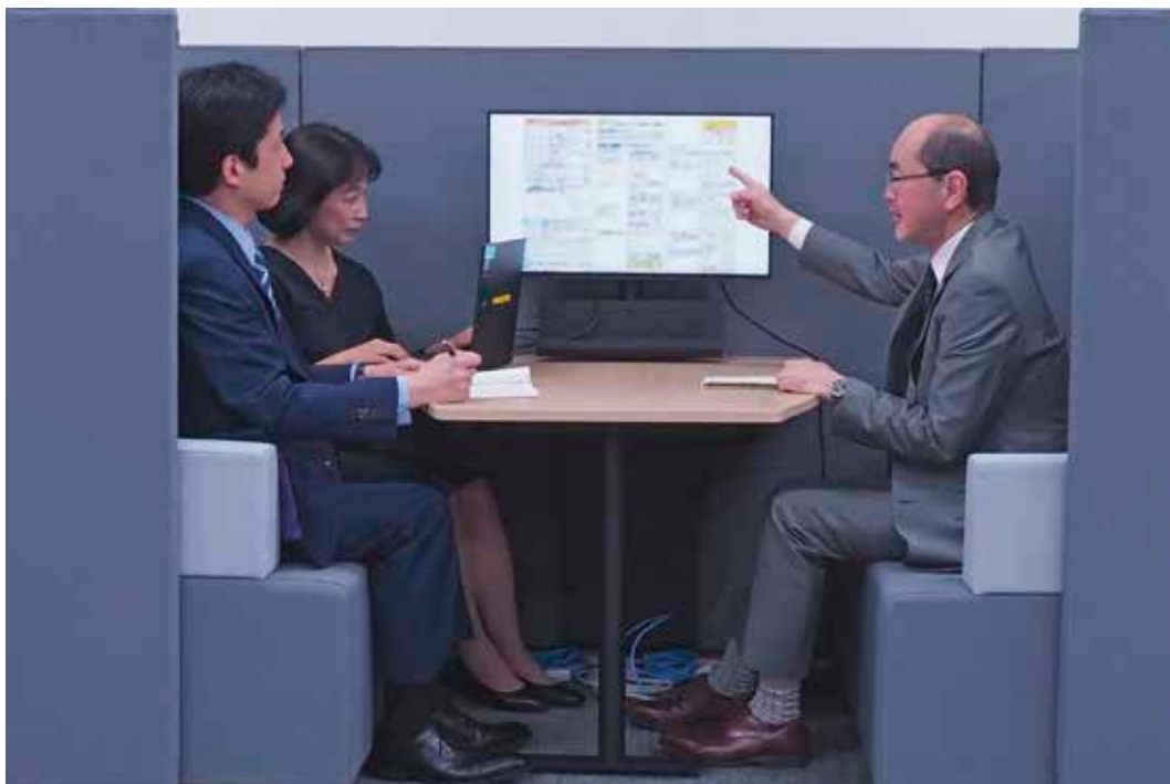
Technical Briefing by Judicial Research Official (調査官による技術説明)

裁判所調査官は、裁判所の命を受け、原則として、特許、実用新案等の技術型の知的財産権関係訴訟の全件に関与し、当該事件の審理、裁判に関して必要な技術的事項を調査します。また、裁判長の命を受けて、口頭弁論期日等において、訴訟関係を明瞭にするため、当事者に対して問いを発することなどができます（民事訴訟法92条の8）。