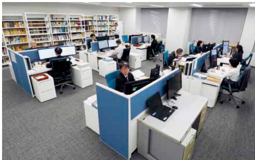
Office of Judicial Research Officials (裁判所調査官室)

In principle, as ordered by the court, judicial research officials are engaged in all technology-based IP-related litigations, such as those related to a patent or utility model, and conduct research on technical matters necessary for the court proceedings and judicial decisions for those cases. As ordered by the presiding judge, judicial research officials can ask questions to the parties concerned on the date of oral argument or on other such occasions in order to clarify the matters related to the suit (Article 92-8 of the Code of Civil Procedure).