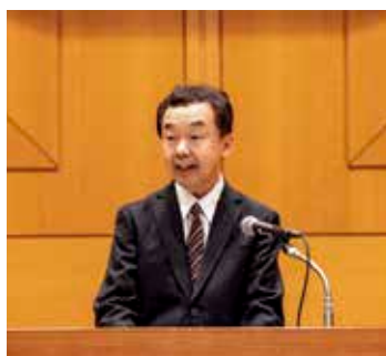
Closing Remarks by Chief Judge, 2022 (所長挨拶 JSIP2022)