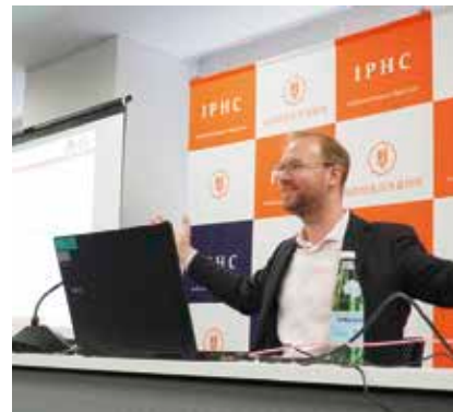
IP High Court Seminar (知財高裁研究会)