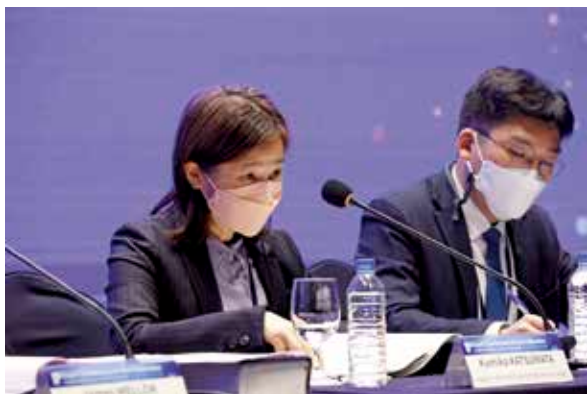
Participation in the International IP Court Conference hosted by the Patent Court of Korea (大韓民国特許法院主催の国際知的財産裁判所会議への参加)

Various international conferences have been held in order to discuss the latest issues concerning IP-related litigation on intellectual property rights, which have been evolving rapidly. Judges of the Intellectual Property High Court attend those conferences and actively participate in the discussions on the latest issues and disseminate information about the practices adopted in IP-related litigation, etc. in Japan.