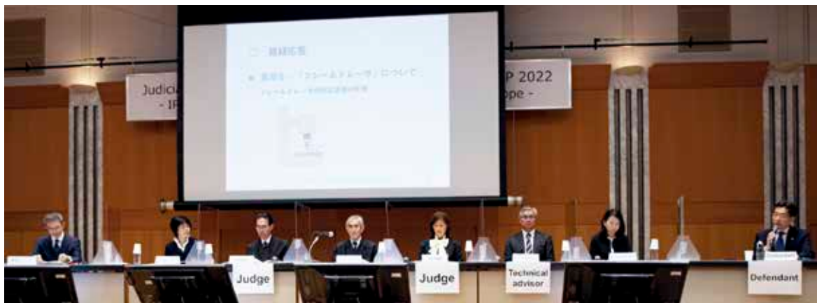
Mock Trial in the Symposium, 2022 (模擬裁判の様子 JSIP2022)

日本の知的財産権関係訴訟に関する制度や運営の実情に関する情報を国内外に発信するとともに、諸外国の情報をその国の実務家から直接得られる機会として、知的財産高等裁判所は、最高裁判所、法務省、特許庁、日本弁護士連合会及び弁護士知財ネットとの共催で、国際知財司法シンポジウム (JSIP) を開催しています。