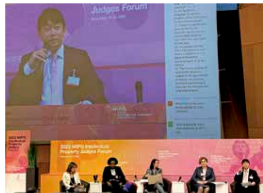
2022 WIPO Intellectual Property Judges Forum in Geneva (WIPO第5回知財担当判事フォーラム、ジュネーブにて)