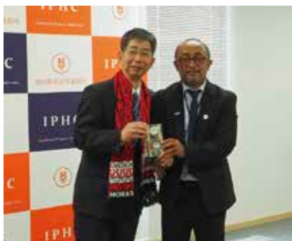
Visit by Judges of the Republic of Indonesia (インドネシア共和国裁判官らの来庁)

The knowledge and information obtained through international information exchanges and the activities of study groups are shared among the judges in charge of IP-related cases, and contribute to the accomplishment of Japanese judicial decisions accepted internationally.