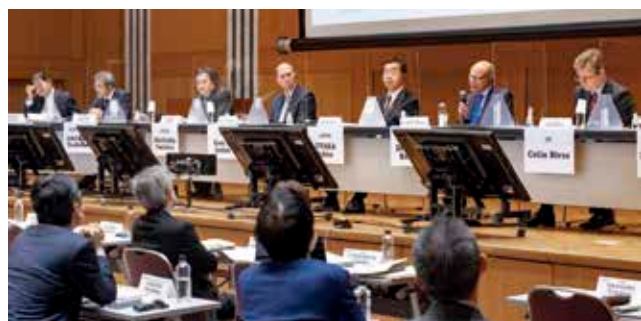
Panel Discussion in the Symposium, 2022 (パネルディスカッションの様子 JSIP2022)