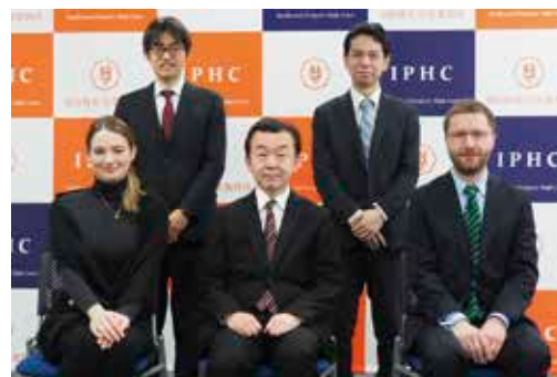
Visit by Judge of the Federal Republic of Germany and Attorney participating in the German Academic Exchange Service Program (ドイツ司法官、ドイツ学術交流会研修生の来庁)