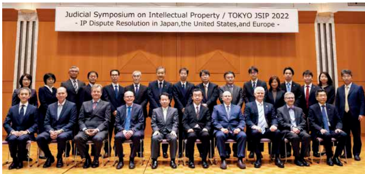
Judicial Symposium on Intellectual Property/Tokyo 2022 (令和4年度 国際知財司法シンポジウム (JSIP2022))

The Intellectual Property High Court has been hosting the "Judicial Symposium on Intellectual Property / TOKYO (JSIP)," hosted jointly by the Supreme Court, the Ministry of Justice, the Japan Patent Office, the Japan Federation of Bar Associations, and the IP Lawyers Network Japan, as an opportunity to internationally and domestically provide information on the system and practice of IP-related litigation in Japan, as well as to obtain information on such issues in other countries directly from overseas practitioners.