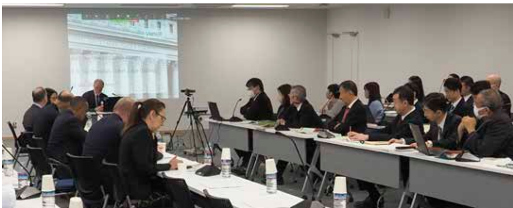
Discussion Session with members of American Intellectual Property Law Association (AIPLA) 2023 (令和5年度アメリカ知的財産法協会所属弁護士らとの意見交換会)