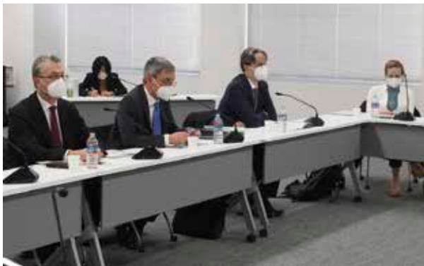
Visit by Judges of the Unified Patent Court (欧州統一特許裁判所の裁判官の来庁)

国際交流や研究会等によって得られた知識や情報は、知的財産権関係事件を取り扱う裁判官同士で共有され、国際的にも通用する日本の裁判の実績に貢献しています。