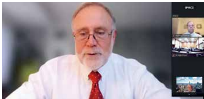
Discussion Session with members of American Intellectual Property Law Association (AIPLA) 2022 (令和4年度アメリカ知的財産法協会所属弁護士らとの意見交換会)

国際交流や研究会等によって得られた知識や情報は、知的財産権関係事件を取り扱う裁判官同士で共有され、国際的にも通用する日本の裁判の実績に貢献しています。