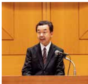
Closing Remarks by Chief Judge, 2022 (所長挨拶 JSIP2022)