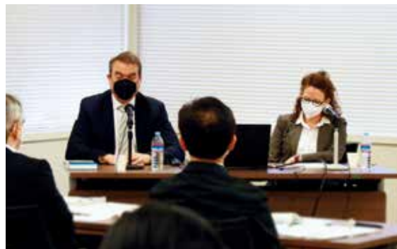
Lecture by Judge and Professor from Germany (ドイツの裁判官・大学教授による講演の様子)