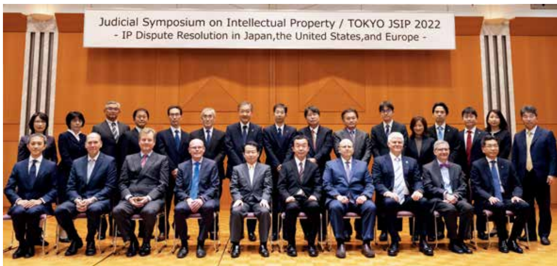
Judicial Symposium on Intellectual Property/Tokyo 2022 (令和4年度 国際知財司法シンポジウム (JSIP2022))

The Intellectual Property High Court has been hosting the "Judicial Symposium on Intellectual Property / TOKYO (JSIP)," hosted jointly by the Supreme Court, the Ministry of Justice, the Japan Patent Office, the Japan Federation of Bar Associations, and the IP Lawyers Network Japan, as an opportunity to internationally and domestically provide information on the system and practice of IP-related litigation in Japan, as well as to obtain information on such issues in other countries directly from overseas practitioners.