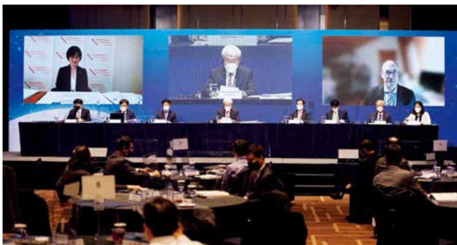
Participation in the International IP Court Conference hosted by the Patent Court of Korea (大韓民国特許法院主催の国際知的財産裁判所会議への参加)

Various international conferences have been held in order to discuss the latest issues concerning IP-related litigation on intellectual property rights, which have been evolving rapidly. Judges of the Intellectual Property High Court attend those conferences and actively participate in the discussions on the latest issues and disseminate information about the practices adopted in IP-related litigation, etc. in Japan.