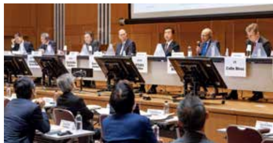
Panel Discussion in the Symposium, 2022 (パネルディスカッションの様子 JSIP2022)