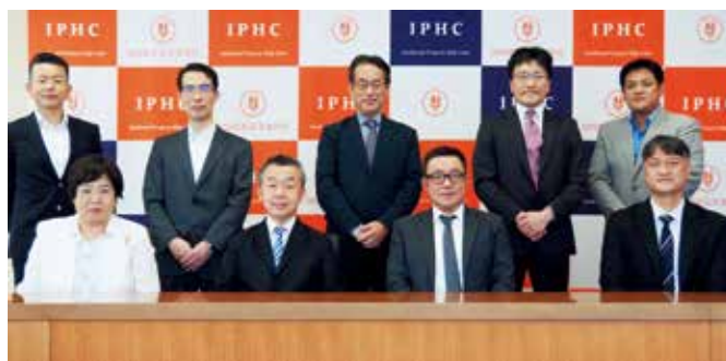
Visit by the Delegation of the Korea Patent Attorneys Association (韓国弁理士会長らの来庁)