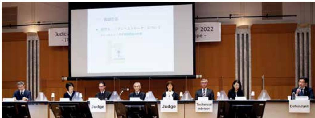
Mock Trial in the Symposium, 2022 (模擬裁判の様子 JSIP2022)

日本の知的財産権関係訴訟に関する制度や運営の実情に関する情報を国内外に発信するとともに、諸外国の情報をその国の実務家から直接得られる機会として、知的財産高等裁判所は、最高裁判所、法務省、特許庁、日本弁護士連合会及び弁護士知財ネットとの共催で、国際知財司法シンポジウム (JSIP) を開催しています。