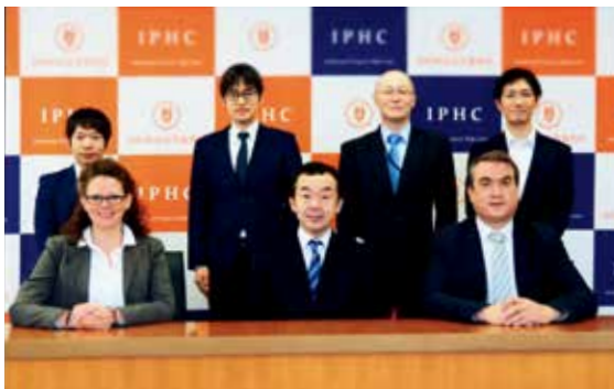
Visit by Judge and Professor from Germany (ドイツの裁判官・大学教授の来庁)

The knowledge and information obtained through international information exchanges and the activities of study groups are shared among the judges in charge of IP-related cases, and contribute to the accomplishment of Japanese judicial decisions accepted internationally.