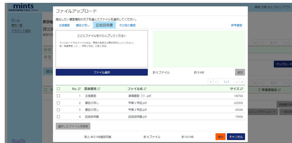
Screen for uploading documents via "mints" (mintsを利用した書面のアップロード画面)