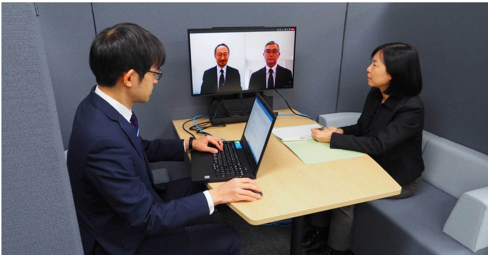
Proceedings using the web conference system in IT booth (ITブースを活用したウェブ会議)