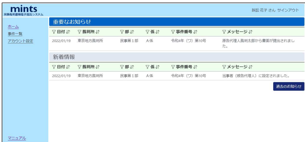
Home Screen of "mints"(mintsのホーム画面)