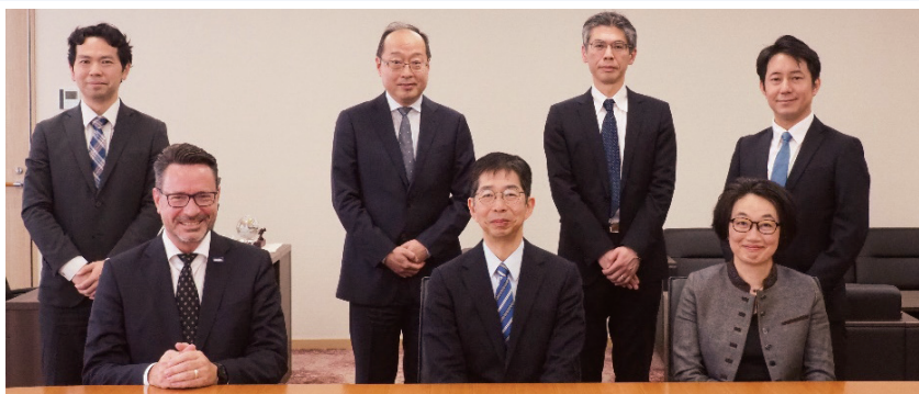
Visit by a Judge from the Munich branch of the Unified Patent Court and others (欧州統一特許裁判所ミュンヘン支部判事らの来庁)

The knowledge and information obtained through international information exchanges and the activities of study groups are shared among the judges in charge of IP-related cases, and contribute to the accomplishment of Japanese judicial decisions accepted internationally.