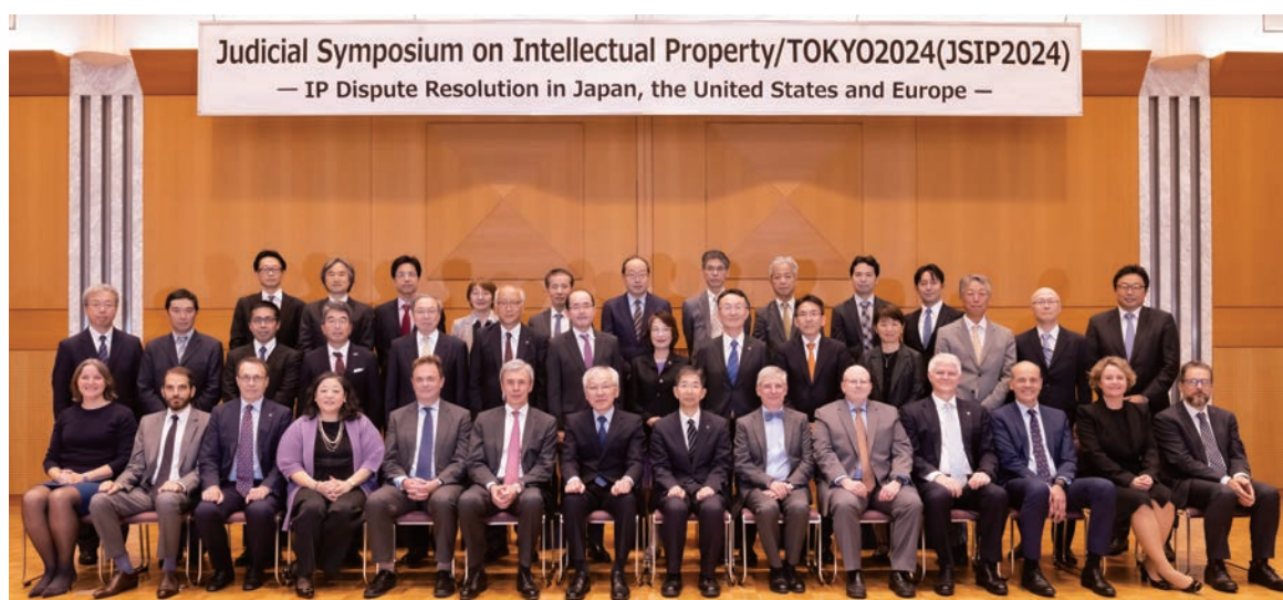
Judicial Symposium on Intellectual Property/Tokyo 2024 (令和6年度 国際知財司法シンポジウム (JSIP2024))

The Intellectual Property High Court has been hosting the “Judicial Symposium on Intellectual Property / TOKYO (JSIP)”, hosted jointly by the Supreme Court, the Ministry of Justice, the Japan Patent Office, the Japan Federation of Bar Associations, and the IP Lawyers Network Japan, as an opportunity to internationally and domestically provide information on the system and practice of IP-related litigation in Japan, as well as to obtain information on such issues in other countries directly from overseas practitioners.