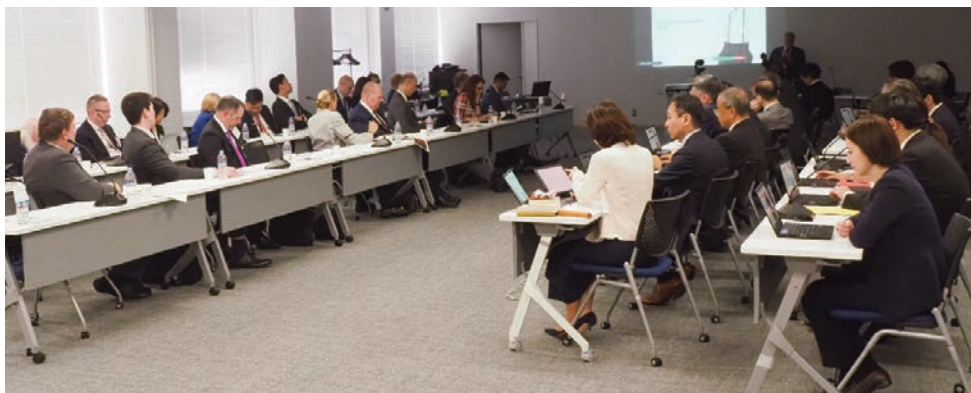
Discussion Session with members of American Intellectual Property Law Association (AIPLA) 2024 (令和6年度アメリカ知的財産法協会所属弁護士らとの意見交換会)