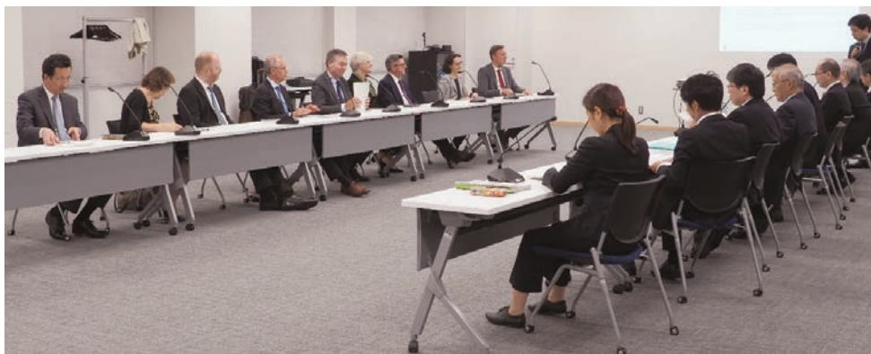
Visit by Delegation from Chamber of Patent Attorneys of Germany (ドイツ弁理士会代表団の来庁)

国際交流や研究会等によって得られた知識や情報は、知的財産権関係事件を取り扱う裁判官同士で共有され、国際的にも通用する日本の裁判の実績に貢献しています。