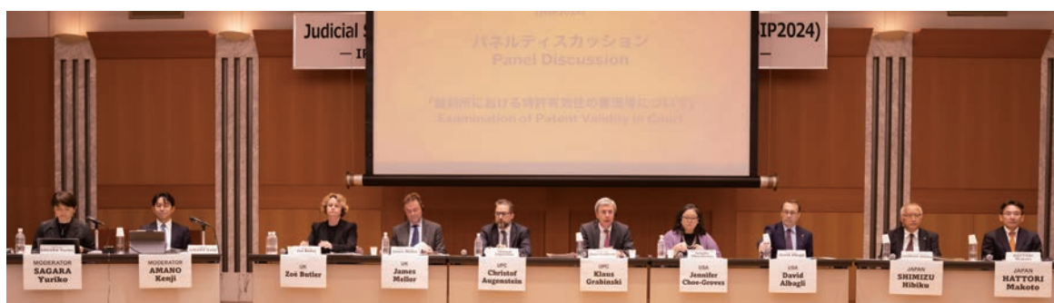
Panel Discussion in the Symposium, 2024 (パネルディスカッションの様子 JSIP2024)