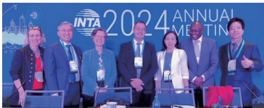
Participation in the International Trademark Association, INTA (INTA (国際商標協会) 2024年次総会への参加)

Various international conferences have been held in order to discuss the latest issues concerning IP-related litigation on intellectual property rights, which have been evolving rapidly. Judges of the Intellectual Property High Court attend those conferences and actively participate in the discussions on the latest issues and disseminate information about the practices adopted in IP-related litigation, etc. in Japan.