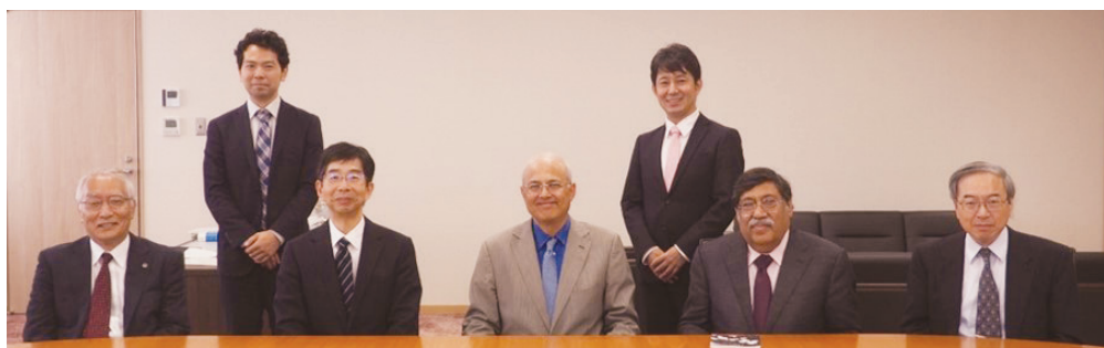
Visit by the Acting Chief Justice of the High Court of Delhi and others (デリー高裁首席判事らの来庁)