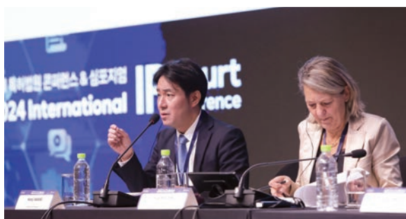
Participation in the International IP Court Conference hosted by the Patent Court of Korea (大韓民国特許法院主催の国際知的財産裁判所 会議への参加)