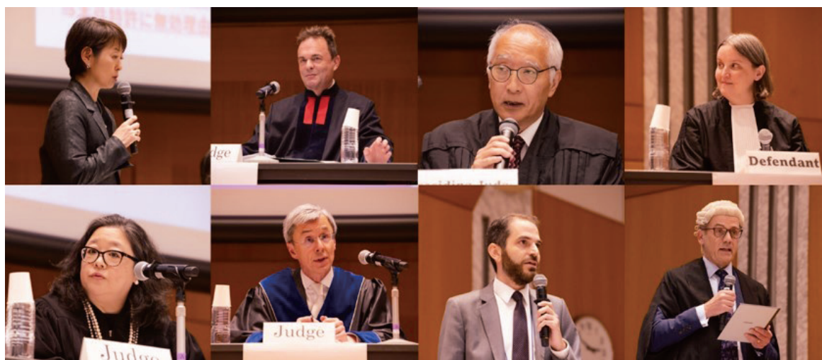
Mock Trial in the Symposium, 2024 (模擬裁判の様子 JSIP2024)

日本の知的財産権関係訴訟に関する制度や運営の実情に関する情報を国内外に発信するとともに、諸外国の情報をその国の実務家から直接得られる機会として、知的財産高等裁判所は、最高裁判所、法務省、特許庁、日本弁護士連合会及び弁護士知財ネットとの共催で、国際知財司法シンポジウム (JSIP) を開催しています。